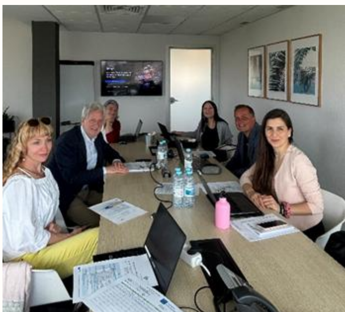
Segunda Reunião Transnacional - Lisboa, maio de 2024