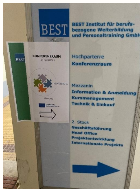
Atividade de Formação – Viena, setembro de 2024